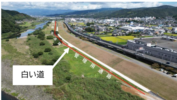
舗装材料1m3当たりCO2排出量試算***