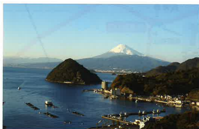
2 三津浜・長浜方面見晴台からの眺望