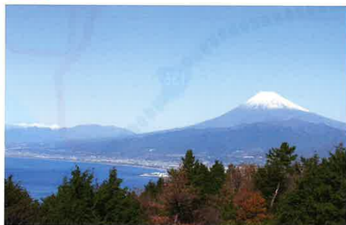
1 発端丈山からの眺望