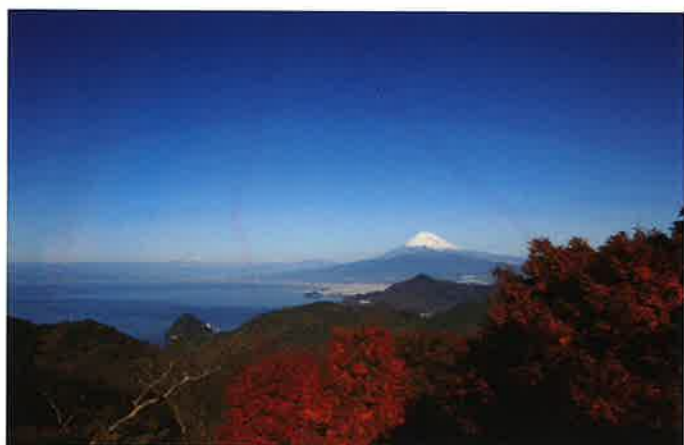
3 葛城山からの眺望