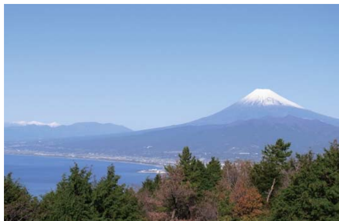
1 発端丈山からの眺望