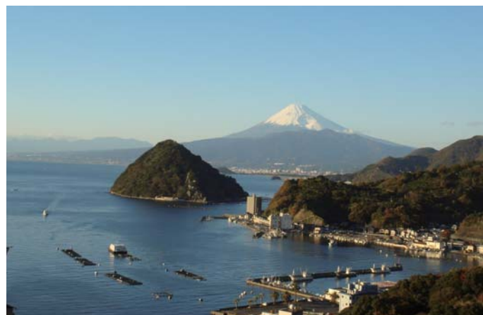
2 三津浜・長浜方面展望台からの眺望