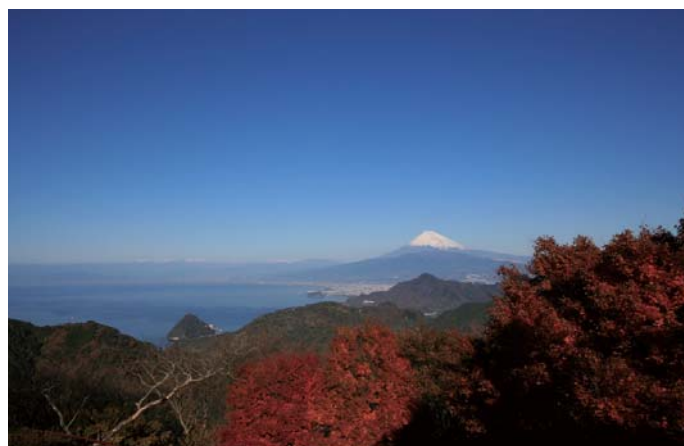
3 葛城山からの眺望