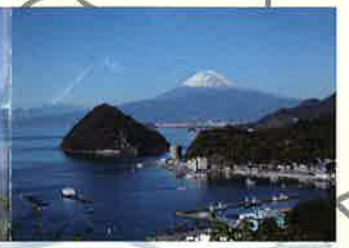
発端丈山の醍醐味はなんといっても淡島越しの富士山！雄大な駿河湾や千本松原、沼津の街並みなどを一望できる贅沢なハイキングコースです。

長浜口から発端丈山を登ると、見晴台と展望台の2つのビューポイントがあります。そこからは、様々な高さ、角度から三浦地区の景色を眺めることができます。