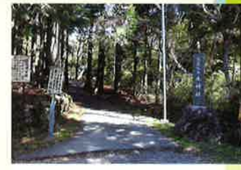
水神社横から頂上を目指す登山口。8台程度駐車も可能です。