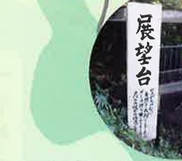
▲それぞれ違った富士山を望むことができる見晴台と展望台