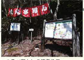
▲つるべ落としの滝登り口

愛鷹山の山頂は、沼津で最も富士山を近くに見る事ができる場所です。山頂には広いスペースがあり、疲れた体をゆっくり癒してから下山をするのがおすすめです。