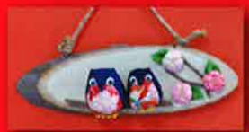
フクロウ 小物各種