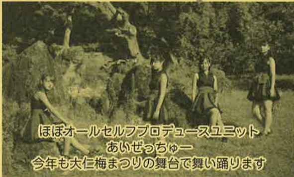
ほぼオールセルフプロデュースユニット あいぜっちゅー 今年も大仁梅まつりの舞台で舞い踊ります