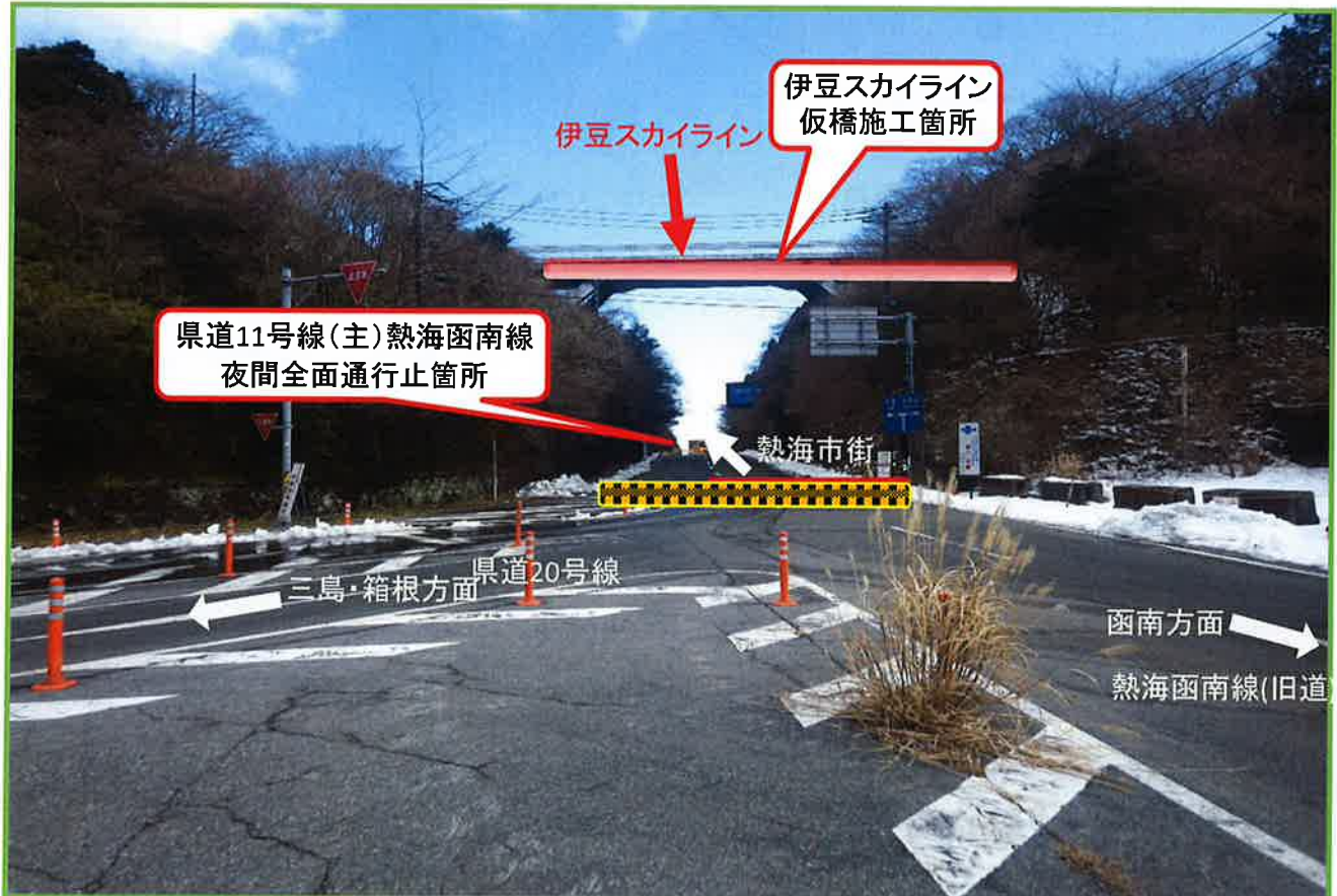
県道11号線(主)熱海函南線の田方郡函南町熱海峠交差点より撮影