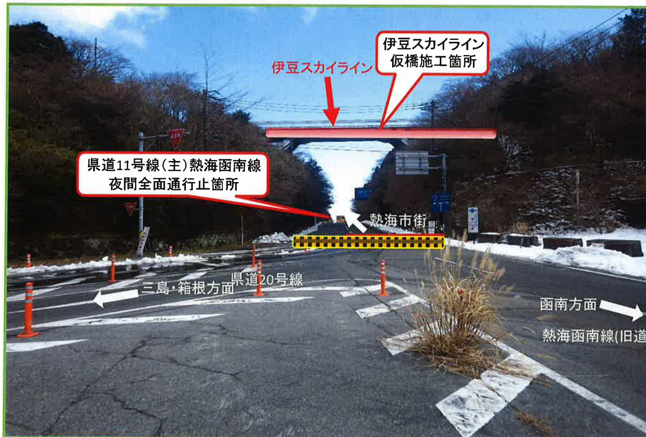
県道11号線(主)熱海函南線の田方郡函南町熱海峠交差点より撮影