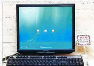
● 無料パソコンコーナー