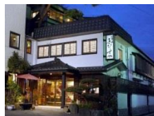
招福の宿あびすや