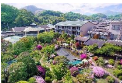
サンバレー伊豆長岡