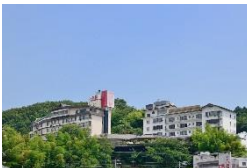
ホテルニュー八景園