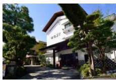
陶芸の宿はなぶさ